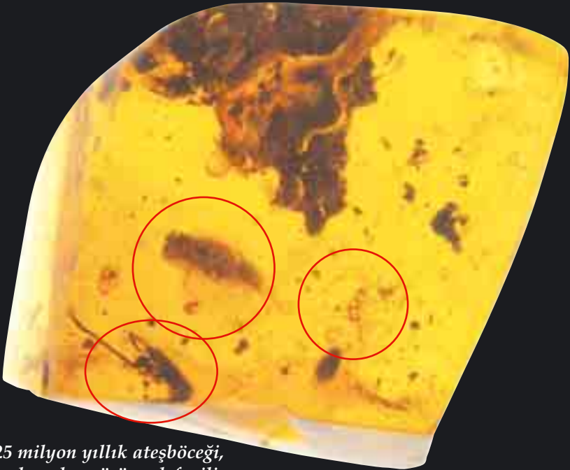
25 milyon yıllık ateşböceği, kırkayak ve örümcek fosili