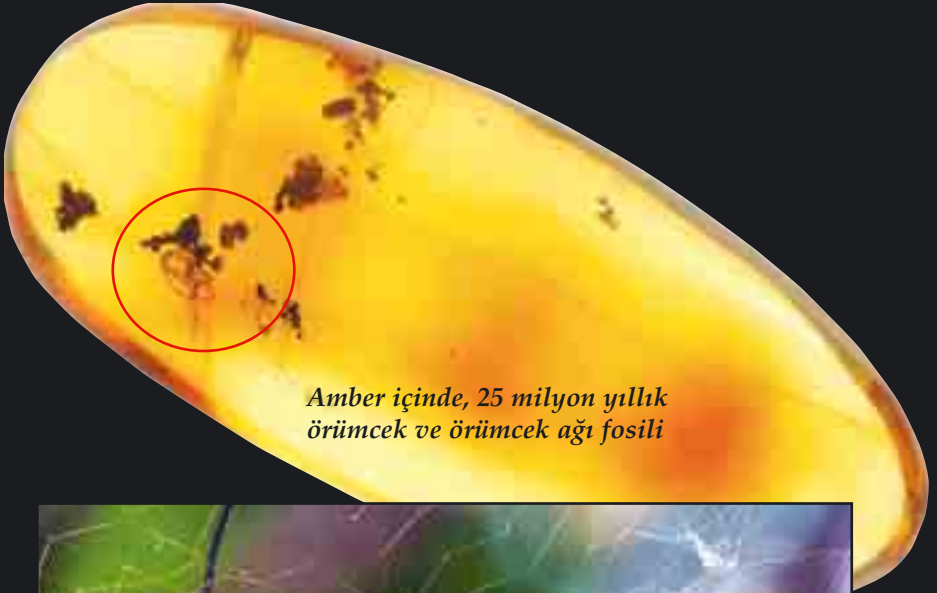
Amber içinde, 25 milyon yıllık örümcek ve örümcek ağı fosili